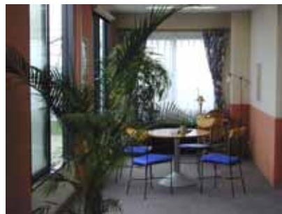
休憩コーナー 音楽を聴くのに最適な緞子張りの壁