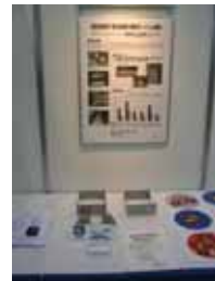
横浜パシフィックテクニカル ショウにて紹介される