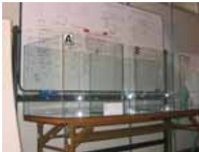
ホルムアルデヒド・VOCの空気濃度測定用グローブボックス