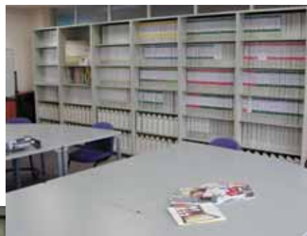
内装材の環境対応サンプル・資料