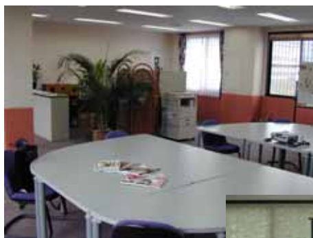
約20名のミーティング環境