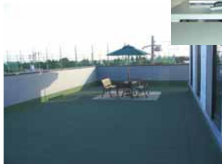
テラス 八景島近くの海が見える