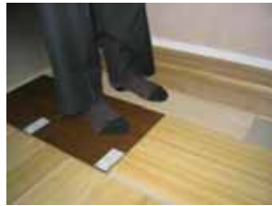
桐床材・珪藻土塗り壁の体感テスト