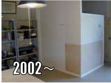
調湿機能材の実験貼り