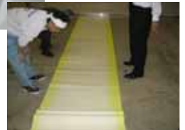
特許申請 平成 17 年 8 月 1 日 平成 17 年度横浜市中小企業 開発助成事業認定