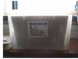
カビ防止剤の効果実験